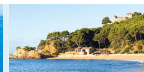
Platja de Fenals Playa de Fenals Fenals Beach Plage de Fenals Strand von Fenals Пляж Феналс