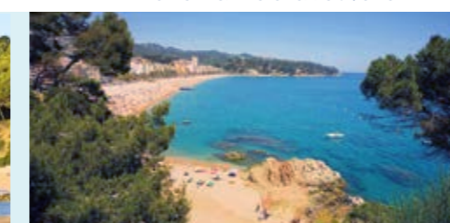
Platja de Lloret Playa de Lloret - Playa principal Lloret Beach - Main beach D'en Lloret - Plage principale Strand von Lloret - Hauptstrand Пляж Льорета - Главный пляж