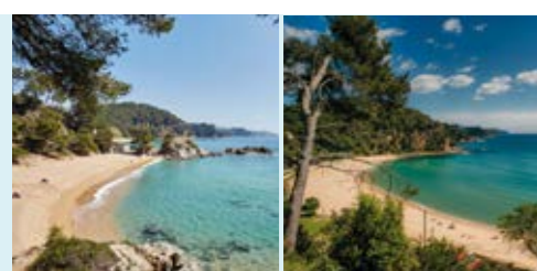
Cala Treumal i Platja de Santa Cristina Playa de Santa Cristina Santa Cristina Beach Plage de Santa Cristina Strand von Santa Cristina Пляж Санта-Кристина