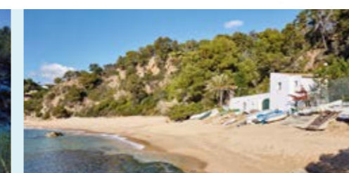
Platja de Canyelles Playa de Canyelles Canyelles Beach Plage de Canyelles Strand von Canyelles Пляж Каньельес

+34 972 36 47 35 +34 972 36 57 88 central-turisme@lloret.cat @lloretturisme @lloretturisme @lloretturisme /Lloretturisme /lloretturisme #mylloret lloretdemar.org