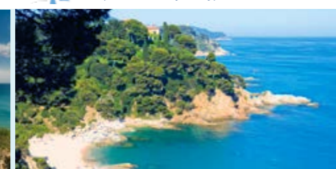
Platja de Sa Boadella Playa de Sa Boadella Sa Boadella Beach Plage de Sa Boadella Strand von Sa Boadella Пляж Са-Боаделья а