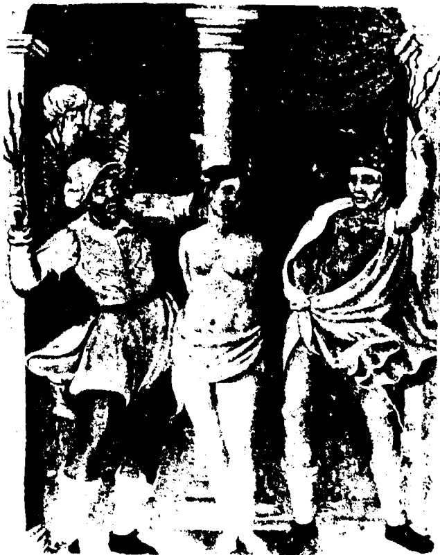
Taula procedent del retaule de Santa Cristina ( segle XVI )