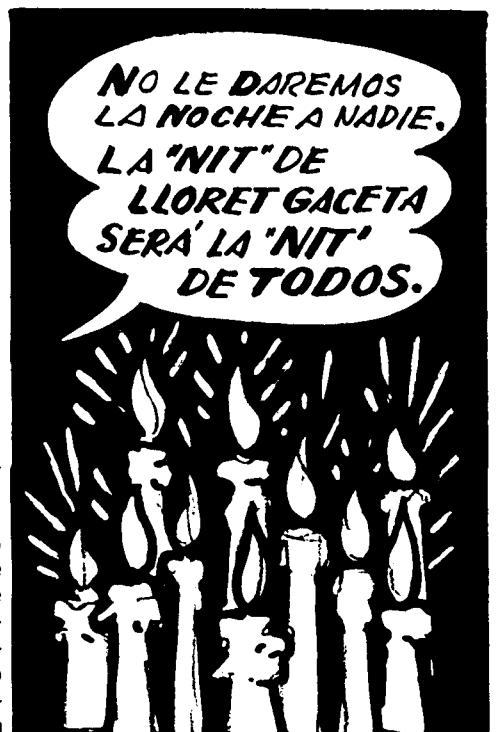
UN SOPLO DE DIEZ VELAS ESPERA

La dicha suele durar poco en casa del contribuyente. — ZADIG, Octubre 84