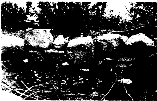
Parament de la muralla nord, que fou destruït per les màquines urbanitzadores.