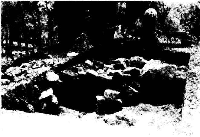
Muralla apareguda a les excavacions de Montbarbat.