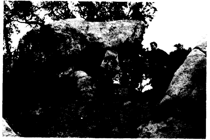
Aparent dolmen de la zona de Montbarbat.

Ajuntament de Casas viejas, en Lloret, en segunda línea. Fincas Rústicas Pisos - Apartamentos - Torres - Chalets Bar propio para Discoteca C/. Mártires, 8 - Tel. 36 57 75 - Lloret de Mar