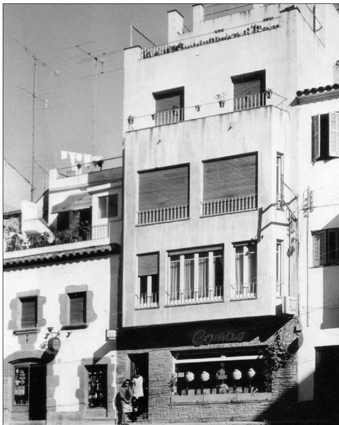
La perruqueria Comas es trobava al C. Cervantes.