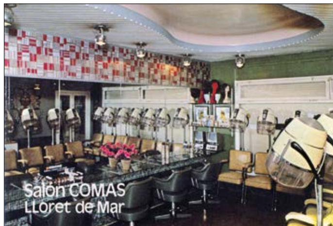
Targeta postal de promoció de la perruqueria Comas.