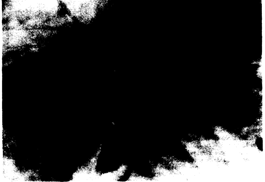
Cul d'àmfora amb una senyal impresa (mesura, senyal de defectuosidat?)