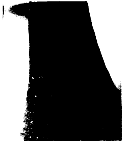
Cul o pivot d'àmfora, amb l'estampilla impresa il·legible.