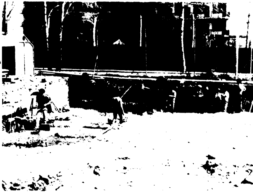
Vista general de les primeres fases de l'excavació de Fenals

En el cas de Fenals, el Centre d'Iniciatives Culturals de Lloret, llavors de recent creació i en plena eufòria, mostrà les restes trobades al malaguanyat arqueòleg Dr. Miquel Oliva i pressionà perquè el possible jaciment pogués ésser excavat. Els intents d'establir contacte profitós amb els propietaris del solar immediat al carrer per part del Dr. Oliva resultaren infructuosos. I així passà el temps.