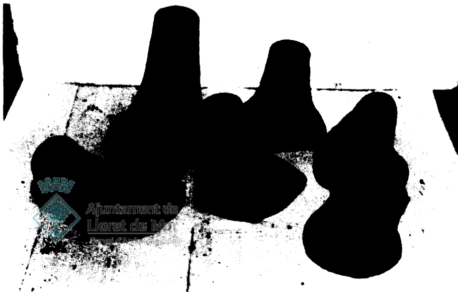
Culs d'àmfora, dels molts apareguts en les excavacions