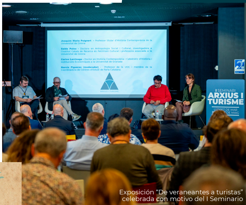
Exposición "De veraneantes a turistas" celebrada con motivo del I Seminario

Esta iniciativa pretende seguir promoviendo el conocimiento, la conservación y la puesta en valor de este patrimonio documental, imprescindible para entender la transformación de la sociedad contemporánea y la importancia del turismo en nuestra historia reciente.